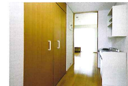
▲居室(ミニキッチン)