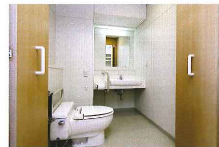
▲居室(トイレ・洗面所)