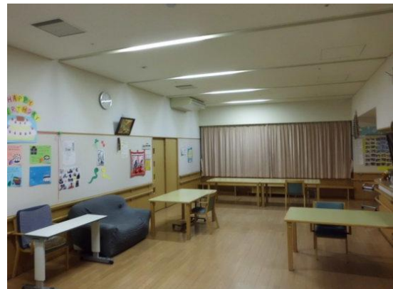
認知症棟食堂ホール