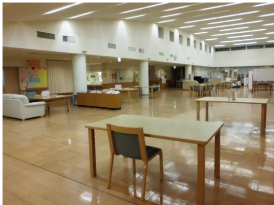
一般棟食堂ホール