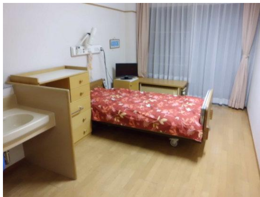
個室(2人・4人部屋もあります)