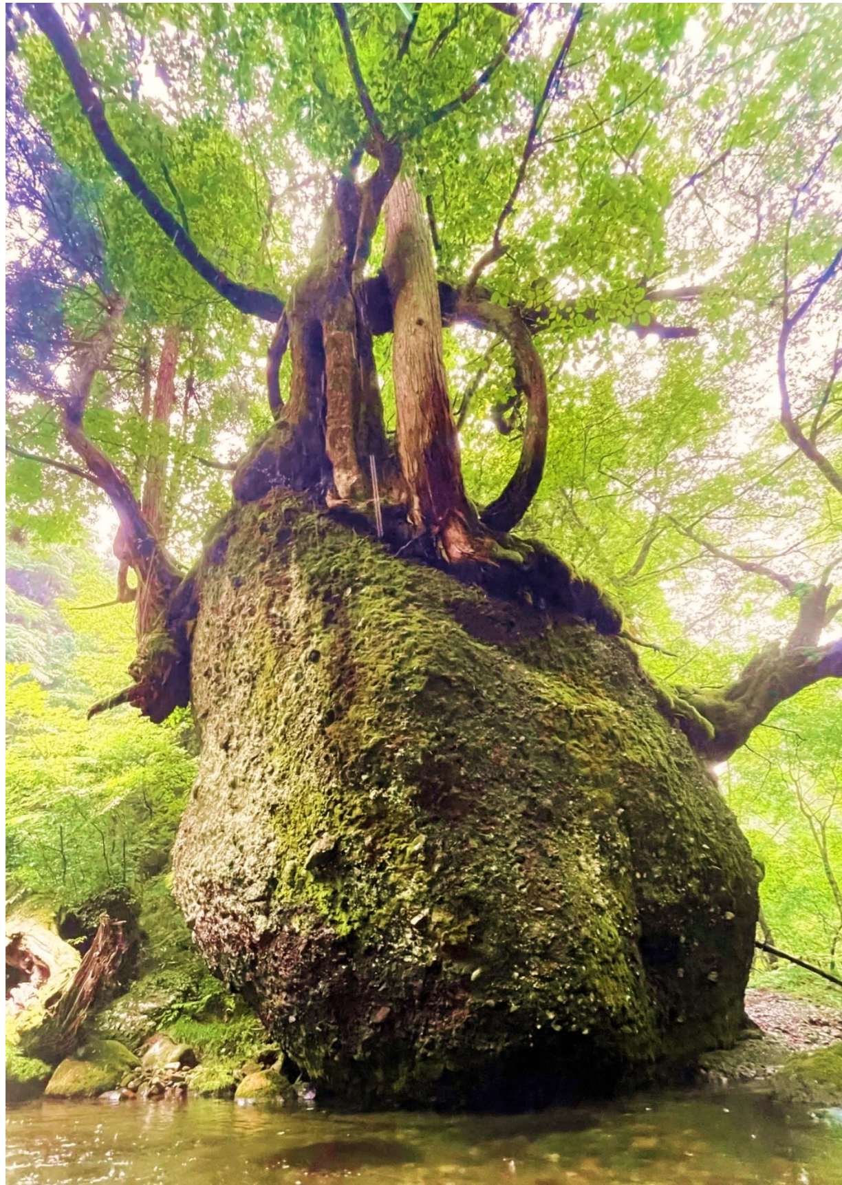
「永遠の息吹」(五城目ネコバリ岩)