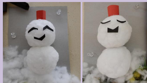
かわいい雪だるまの登場です